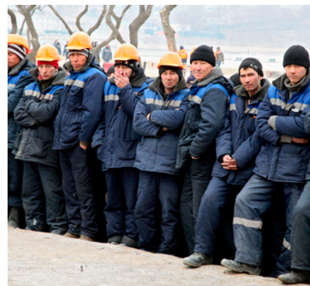
Санкт-Петербург, Кронверкский пр., д. 7), Коломяжской мечети (адрес: Санкт-Петербург, ул. Репищева, д. 1).

По пятницам запланировано проведение мероприятий на территории Сенного рынка, на территориях, прилегающих к Соборной мечети (адрес: